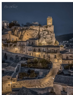
CASTELLO DEI CONTI

La straordinaria città offre un clima mite tutto l'anno, una squisita cucina regionale con ottimi vini e il famoso cioccolato preparato secondo l'antico metodo azteco di lavorazione a freddo, importato in Sicilia dagli spagnoli, oltre a bellissime spiagge e meravigliosi monumenti.