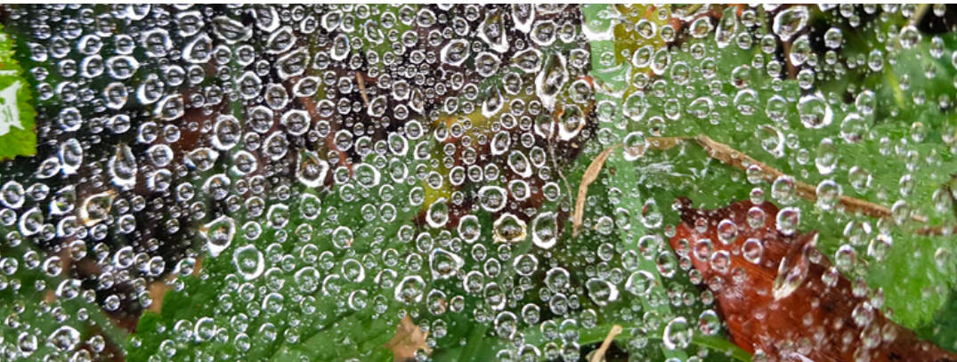
[Together-alone]YF/ JUIN 2022